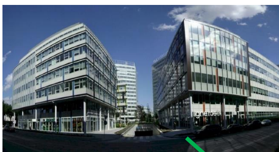
Apollo business center II

Pressburg Tower se nachází v lukrativní části Bratislavy, přímo v srdci známé byznys zóny, na Pynárenské ulici v Bratislavě II. Jde o strategickou polohu, která je znásobena výbornou dostupností díky napojení na hlavní městské dopravní uzly a Přístavní most či most Apollo, které vedou přímo na hlavní bratislavský obchvat. V dostupné vzdálenosti se nacházejí zastávky MHD s autobusovými a trolejbusovými linkami, jakož i hlavní autobusové nádraží Mlynské Nivy. V bezprostředním okolí se nacházejí všechny potřebné služby – restaurace, obchody, notář, lékárna.